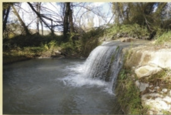
Cascada de la Media Luna