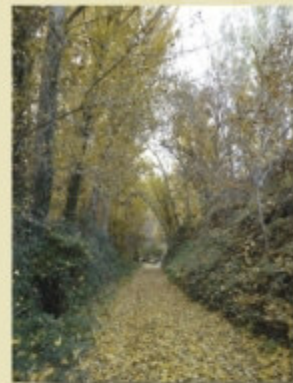
Alameda junto al inicio del sendero

Tomamos altura para disfrutar de unas estupendas vistas del cauce del río y hacia arriba de Ribera Alta, Frailes y el cerro de la Martina al fondo y mirando hacia abajo la aldea de Ribera Baja. Y al descender, ya cerca del final de nuestra ruta, encontramos la fuente del Cortijo del Baño que nos ayudará a refrescarnos.