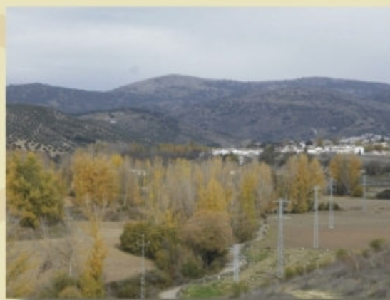
Vista de Ribera Alta con el cerro de la Martina al fondo

Alcalá la Real, es Conjunto Histórico Artístico, destacan la Plaza del Ayuntamiento, La iglesia de Consolación y el Palacio Abacial.